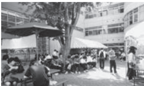
文化祭・芋煮会場