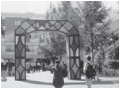
文化祭・校門のアーチ