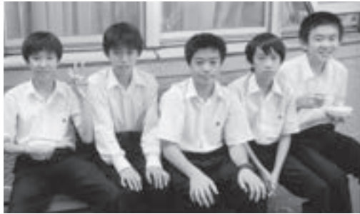
文化祭・芋煮会場にて